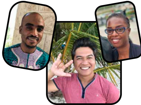
牧師/伝道者たち (抜粋) A few of the pastors/evangelists

スポンサー可能な牧師の詳細、また学生や学校のスポンサーシップについてなど、詳細はウェブサイト ( https://japan.deafmin.org/sponsorship/ ) をご覧になるか、 info@japan.deafmin.org までお問い合わせください。