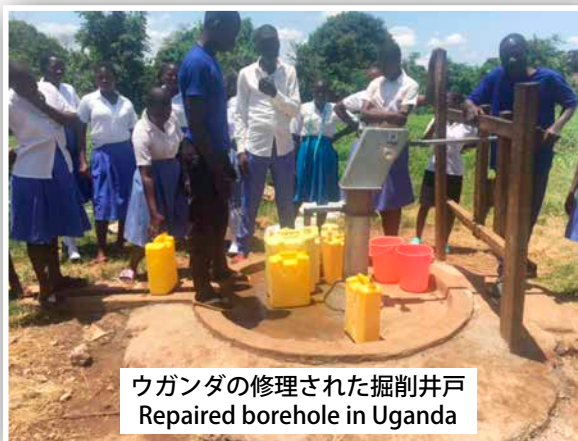
ウガンダの修理された掘削井戸 Repaired borehole in Uganda

できました。以前は、最大50人の女子生徒が2台の古いミシンを共有していました！14台の新しいミシンのおかげで、待ち時間が大幅に短縮され、授業もより実践的になりました。