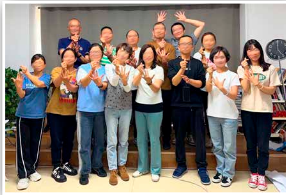
中国の仲間たち (安全上の理由で顔をぼかしています) China group (faces blurred for security)

彼らはこの「恵みの線」を書き留め、この期間、誰もあきらめず、誰も失わなかったことに驚くと同時に感謝しました。そしてこれを機にこのチームは、政府やより広範囲の教会と協力して宣教するために資源を用いる計画を立てました。資金調達と実りある生活のための目標が設定され、社会的、霊的なアウトリーチのための目標も設定されました。参加者は皆、このトレーニングと、中国のろう者たちの将来への期待に大きく胸を膨らませました。