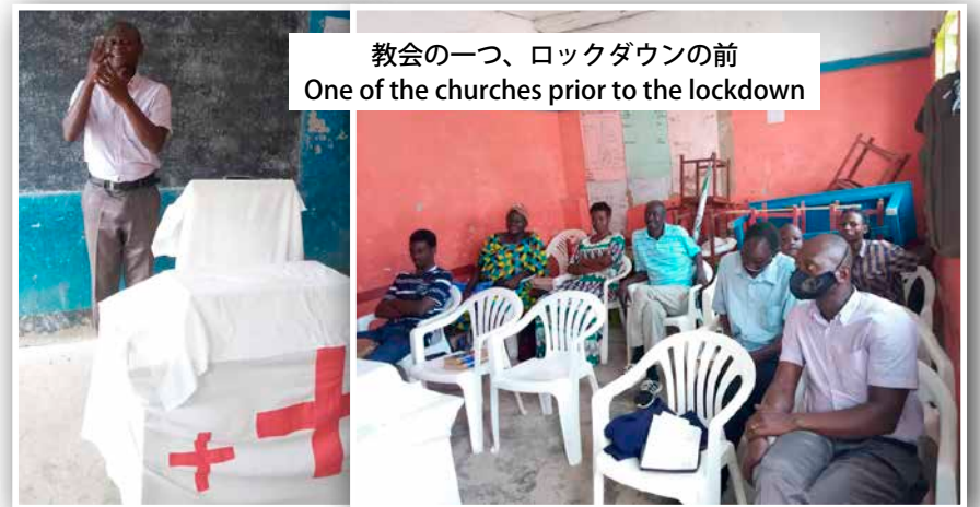
教会の一つ、ロックダウンの前 One of the churches prior to the lockdown

このことは、ウガンダにある9つのDMIろう者教会と、そこで働いている牧師や伝道者にも影響します。アフリカのシニアアドバイザー、サム・ベグミサは、リチャード・オドンゴが伝道者として、またろう者教会のリーダーとして働いているウガンダ中部のクワニアでのミッションを担当していました。サムは安全上の理由からデニス・ダグケネと一緒にリラに滞在し、車で移動して、リチャード