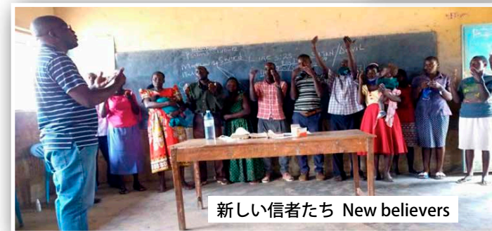
新しい信者たち New believers

との伝道活動に加わりました。18人のろう者が集会で御言葉を聞き、キリストを受け入れました。彼らはすぐにバプテスマを受けたかっただけですが、水場まで2キロもあったので、バプテスマを後日に延期しなければなりません。私たちの伝道者は神の言葉を広め続けており、困難な時代であっても、神の愛は人々の人生に浸透しています。これは良い知らせです！