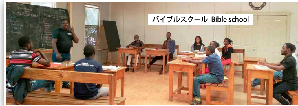
バイブルスクール Bible school

カンパラにはDMIバイブルスクールがあり、現在10名の生徒が学んでいますが、中にはザンビアやコンゴから来た生徒もいます。6月中旬、ウガンダの大統領はコロナウイルスのため、すべての学校に42日間の閉鎖を命じました。ザンビアとコンゴの学生が帰国するには費用がかかりすぎるため、学生たちがウガンダに滞在し、一刻も早く予防接種を受けられるよう許可を得ることができました。彼らと先生方のためにお祈りください。