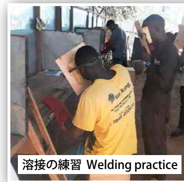
溶接の練習 Welding practice

2021年のインターンシップは、「デフ・アクション (DMIの教育部) ウガンダ」を通じて募集された3人のろう者のインターンと、私たちの地元のバワンボ村からの2人の聴者のインターンによって、2021年3月15日に始まりました。他の何人かのろう者インターンは、私たちの場所がカンパラに近いことや、最近の選挙による緊張感が親たちに安全上の懸念をもたらすことから、トレーニングを開始しませんでした。上の写真は、アイデアワークショップのスタッフ、2021年のインターン生、デフ・アクション・ウガンダのスタッフが一緒にいるところです。