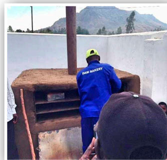
パン屋のオープン Bakery oven

昨年、マラウイでは広範囲にわたる洪水が起こり、農場の作物は被害を受け、たくさんの人々が食糧不足で苦しみました。DMIの「Deaf Action」ベーカリーというパン屋も例外ではなく、洪水から免れることはできず、パン、配達用の自転車、お金も水に流され失ってしまいました。