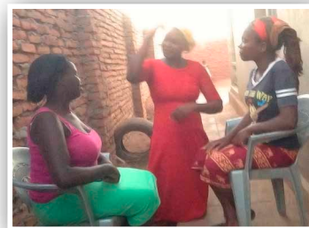
手話を教える Teaching sign language

マラウイの教会は成長しています！マラウイの教会には、手話を知らない聴覚障害者も来ています。このことは、他の教会のメンバーにとって、彼らに手話と福音を同時に教えることができる素晴らしい機会になります。それによって、これらの聴覚障害者の人々の中で家族や友人と初めてコミュニケーションをとれるようになった人もいます。