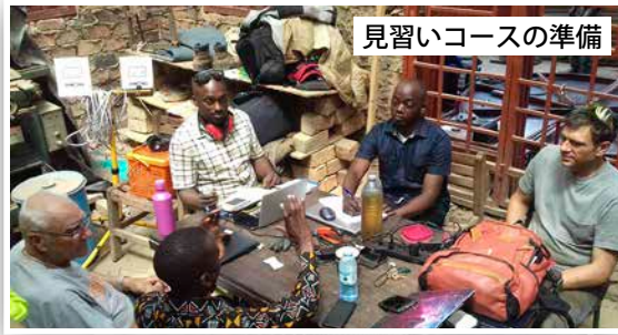
見習いコースの準備

2月にクリスチャン宣教師団体主催のワールドベンチャーに5人のろう者男性が見習いをする特権が与えられています。このコースの修了後、この青年達は職についたり、小規模の会社を作る事ができるはずで、障害を持っている方々は、見下げられていて国で良い仕事につくのは難しいですが、DMIはろう者青年に良い教育をし、良い仕事につくことができるよう祈り願っています。