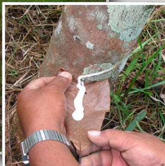
ゴムの木の農場、 ゴムの乳液、DMI 農 場のトラックに乗車 The rubber plantation, a flow of latex, and riding in the DMI truck