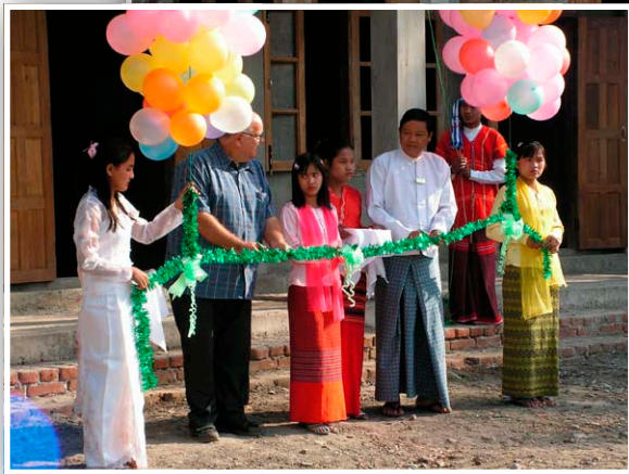
カレー学校のビル、 献堂式、お風呂 Kalay school building, dedication ceremony, and bathing area