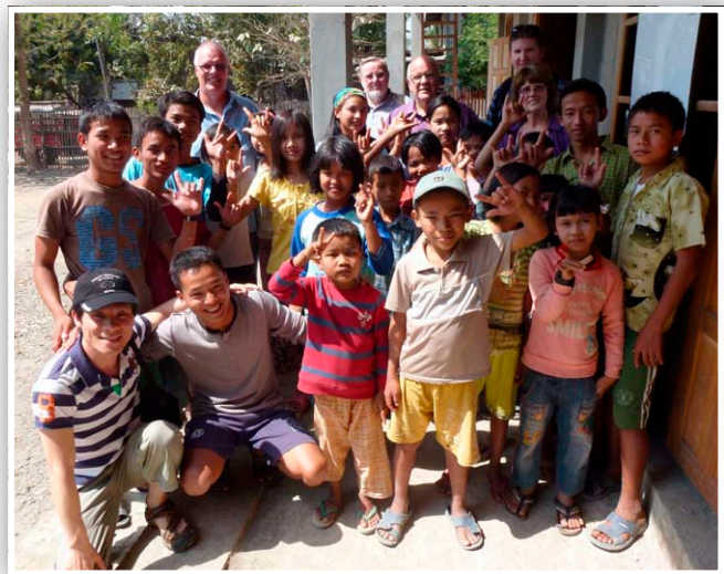
カレー学校で、子どもたちとポーズをとる Posing with children at the Kalay school