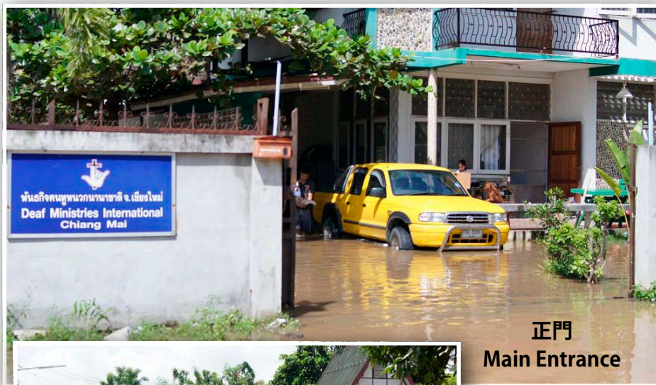
正門 Main Entrance

災害は一段落したと安堵していたところ、タイから、自分たちの敷地に洪水が入ったとの知らせがありました。そ