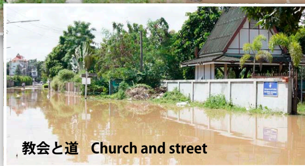
教会と道 Church and street

ので、大きな試練となっています。まだ被害額は分かりませんが、その災害に立ち向かえるようお祈りください。