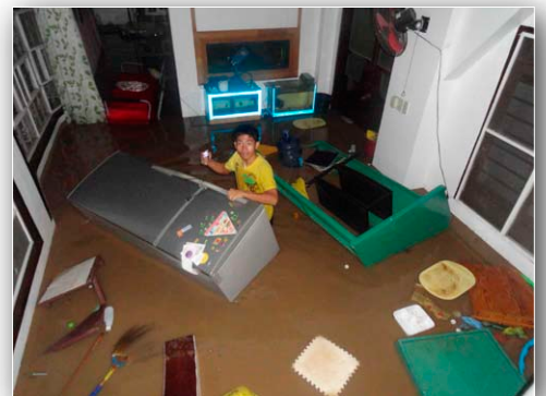
物を持ち出す Saving items

幸いなことに私たちの建物は3階まであり、水が増してきても逃げ場がありました。お昼頃まで水が増したり退いたりするのを眺めていました。隣人たちは自分の家の屋根に上がっていました。DMIの高い建物を感謝します。屋根に上ることなく、床のスペースがありました。