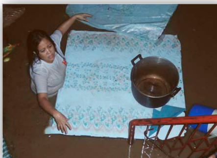
上がっている水位 Rising water

未明のことで皆が深い眠りについていて、2階で寝ていた私たちは一階での物音と停電のため目が覚め、水は腰までの高さには達し、強い勢いで流れていました。一階に居たろうの子どもたちは自分の物を持ち出していました。一人の少年は眠り続けてベッドが水浸しになって始めて目が覚めました。持ち出せないで流されたものは、冷蔵庫、アイロン、ストーブ、扇風機、台所用品、椅子、ソファ、戸棚、テーブルなどでした。