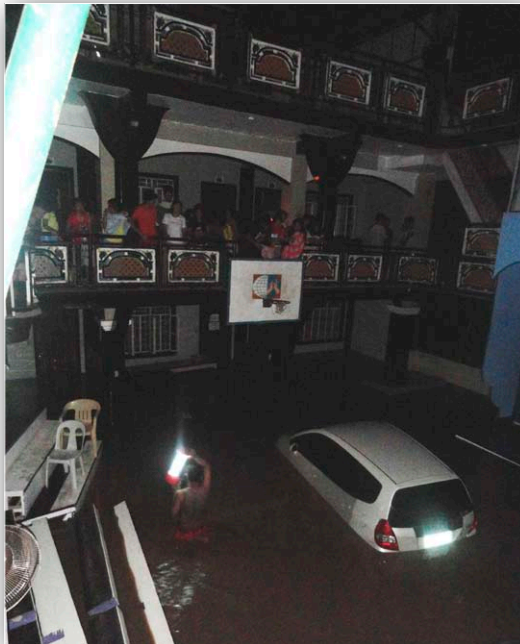
ダバオ寮の中 Inside the Davao dorm